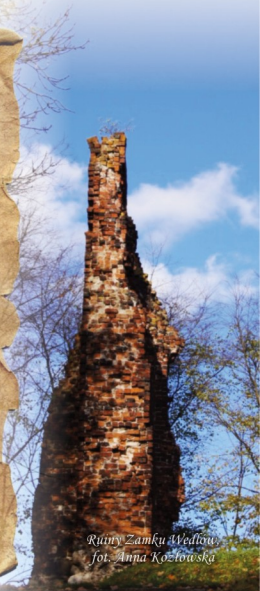
Ruiny Zamku Wedłów

Zamek często zmieniał swą podległość. Obok Wedłów stacjonowali na nim Krzyżacy, Polacy i Pomorzanie Eryka II. W czasie wojny trzydziestoletniej zamek podupadł. Kolejnych zniszczeń dokonały w 1675 r. wycofujące się wojska szwedzkie. W 1691 r. runął jego szczyt północny. Reszty dopełniły wojska rosyjskie przechodzące przez Drawno w 1758 r. podczas wojny siedmioletniej. Zamek w przyziemiu wzniesiony był z kamieni polnych a powyżej z cegły. Grubość murów obwodowych wynosiła 1-1,7 m. Był trzykondygnacyjny: parter ok. 3,20m, I piętro 4m, II piętro 3m wysokości. Na I piętrze od strony wschodniej znajdowały się okna strzelnicze, możliwe że były też na II piętrze. Zamek chronił jezioro oraz strome zbocze i sucha fosa, nad którą znajdował się prowadzący do wjazdu most. W XIX w. Wzgórze zostało uporządkowane i wyprofilowane w tzw. romantycznym stylu. Tak pozostało do dziś.