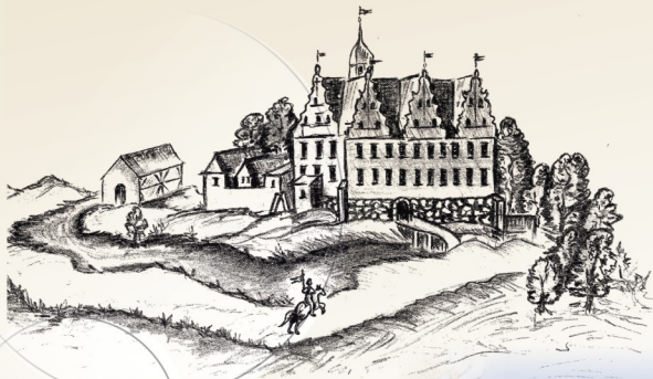
Zamek Wedłów w Drawnie, rys. E. Bacztub