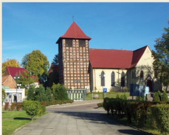
Kościół w Drawnie