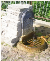
Studnia artezyjska

W śródmieściu zachował się dawny układ urbanistyczny miasta z rynkiem i wąskimi uliczkami, przy których stoją domy z XVIII i XIX w. Właśnie przy niektórych z nich znajdują się zabytkowe źródła wód artezyjskich, zdalnych do picia.