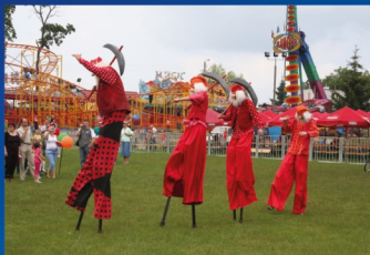
Drawieński Festiwal Krasnali

światowego. Nie zmienia to faktu, że Drawno należy do „kolebek” terakotowego krasnala ogrodowego. Siedziba firmy mieściła się przy dzisiejszej ulicy Choszczeńskiej. Po wojnie budynek fabryki służył różnym funkcjom, obecnie znajdują się tu warsztaty samochodowe.