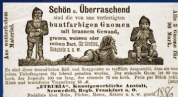
Krasnale z drawieńskiej „Etrurii” – oferta handlowa z 1886 r., fot. Zwergen-Park, Trusetel.

W 2006 r. w Niemieckiej gazecie „Frankfurter Rundschau” zamieszczono ofertę sprzedaży Drawieńskich Krasnali produkowanych przez firmę „Etruria”, z 1886 r. z gazety „Deutschen Illustrierten Zeitung”. Dotychczas najstarsza oferta pochodziła z 1893r. z Turyngii. Oferta drawieńskiej „Etrurii” przedstawia trzy krasnale: stojącego, leżącego i siedzącego na pieńku za ceną 90 marek. Firma oferowała również terakotowe scenki rodzajowe z bajek (np. Jaś i Małgosia, Kopciuszek, Czerwony Kapturek, Królewna Śnieżka i 7 krasnali). Proponowanych wzorów było ponad 100, a motywem przewodnim były krasnale. Niestety, nie wiadomo kiedy zaprzestano w Drawnie „krasnalą” produkcję. Najprawdopodobniej zakład upadł w okresie kryzysu