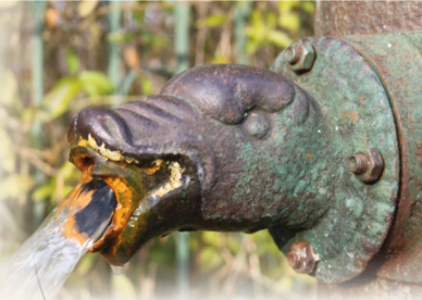
Studnia artezyjska

Nazwa pochodzi od hrabstwa Artois we Francji w której w roku 1126 powstały pierwsze w Europie tego rodzaju studnie. Są one sztucznie wiercone w wyniku czego woda pod ciśnieniem hydrostatycznym wytryska z ziemi często jako fontanna. Takie studnie artezyjskie z samoczynnie wypływającą wodą, są również na terenie Drawna. Powstały na przełomie XVII i XIX w. znajdują się przy ulicy: Szkolnej, Ogrodowej, Tylnej i Kolejowej oraz przy Placu Zgody.