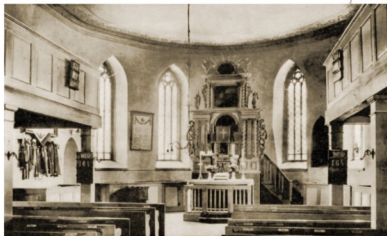
Wnętrze kościoła pw. Matki Bożej Nieustającej Pomocy

Stargardu, drewniana chrzcielnica z XIX w., tablica upamiętniająca 112 poległych parafian w czasie I wojnie światowej, krzyż z lat siedemdziesiątych XX w. oraz witraże wykonane w latach 1987-88. W prezbiterium umieszczono epitafia Rüdigiera von Wedel i Pani von Unruh z domu Seidlitz, którzy spoczęli w kryptach grobowych pod ołtarzem.