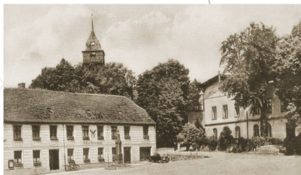
Dawniej Marktplatz, dzisiaj Plac Wolności