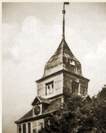
Wieża kościoła w Drawnie z XVII w., fot. arch. UM Drawno