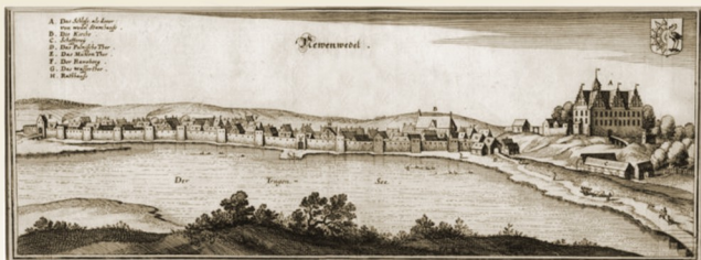
Panorama Drawna z ok. 1652 r., wg. M. Meriana