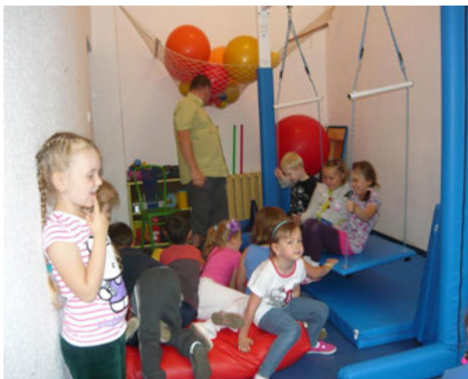
Bawimy się w Niemieńsku