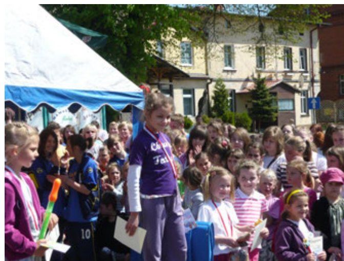
Biegi uliczne .