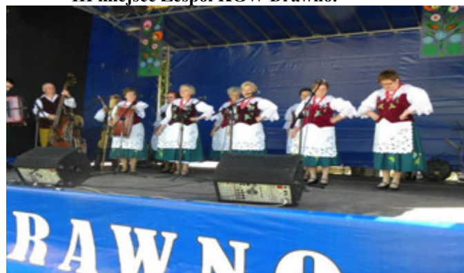
I miejsce Zespół Stawnianki