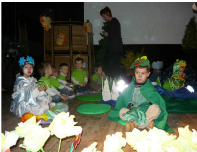
Maluchy witają wiosnę.