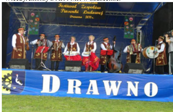
Dębniacy (II miejsce)