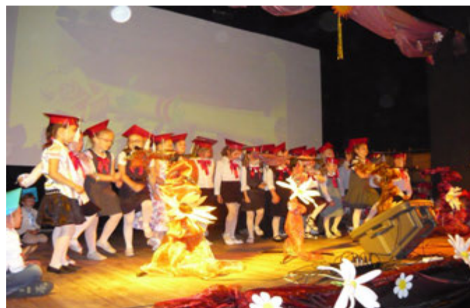
Zakończenie roku przedszkolnego

Cały rok przedszkolny bardzo szybko minął. W pracy przedszkola, w przygotowaniu uroczystości w organizacji wycieczek pomagali nam nasi super rodzice. Nigdy nas nie zawiedli. Serdecznie im za tą pracę dziękujemy. Przedszkole pracuje do 30 czerwca. Od 01 lipca do 15 sierpnia placówka jest zamknięta z uwagi na konieczność wykorzystania przez pracowników urlopów. 28 sierpnia od godziny 10.00- 13.00 zapraszamy do placówki dzieci, które przyjdą do nas po raz pierwszy na wspólne zabawy. Jest to dzień otwarty w naszej placówce. Rodzice będą mogli spotkać się z nauczycielami. Z uwagi na to iż zaczynają się wakacje życzymy dzieciom wspaniałej pogody, bezpiecznych i mądrze wykorzystanych wolnych od zajęć dni. A rodzicom wytrwałości i jak najmniej problemów wychowawczych.