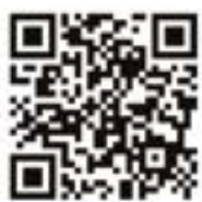
USŁUGI TURYSTYCZNE NOWAK