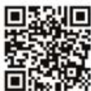
RANCZO U GÓRALA