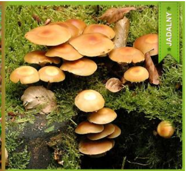
Helmwóčka obrzeżona ( Galerina marginata ) i Łuszczak zmienny ( Kuehneromyces mutabilis )