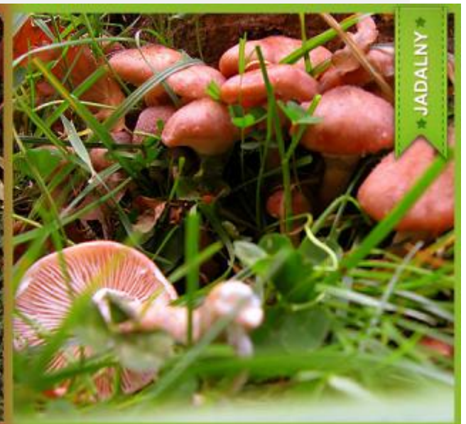
Zastónak rudy ( Cortinarius orellanus ) i Płachetka kółpakowata ( Rozites caperata )