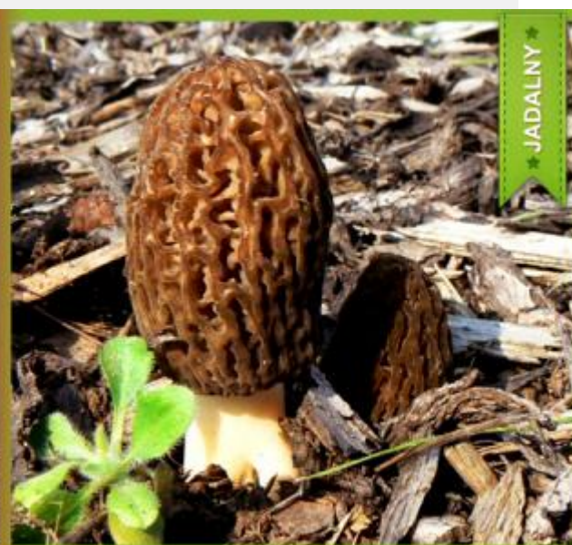
Piestrzenica kasztanowata ( Gyromitra esculenta ) i Smardz praski ( Morchella pragensis )

Jeżeli nie jesteś pewien, czy grzyb, który wkładasz do koszyka, jest jadalny – nie ryzykuj – nawet najbardziej doświadczonym grzybiarzom przytrafiają się pomyłki, które mogą być tragiczne w skutkach!