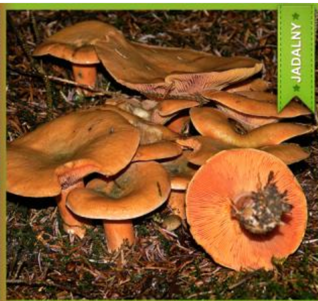
Zasłonak spiczasty ( Cortinarius rubellus ) i Mleczej świerkowy ( Lactarius Deterrimus )