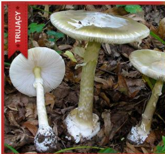
Muchomor jadowity ( Amanita virosa ) i Czubajka kania ( Macrolepiota procera )