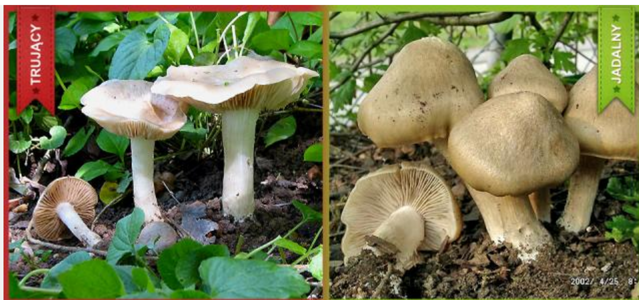
Strzepek ceglasty ( Inocybe patouillardii ) i Wietruszka tarczowata ( Entoloma clypeatum )

Grzyby opisane w lewej kolumnie są śmiertelnie trujące, a niebezpieczeństwo z nimi związane wywodzi się z faktu, że łatwo je pomylić z innymi gatunkami grzybów, zwłaszcza egzemplarzy młodych. Pierwsze objawy zatrucia często pojawiają się długo po spożyciu, w niektórych przypadkach nawet po kilku dniach. Przez ten czas trucizny w nich zawarte, a spożyte przez nieostrożnego grzybiarza, robią spustoszenie w organizmie.